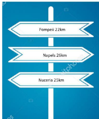
Onderdeel van de topografieopdracht