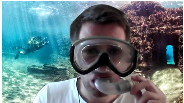
Screenshot uit het filmpje van dag 4, Baiae

Hoewel in het vervolg van de week de groep actieve deelnemers aanzienlijk was geslonken (niets was verplicht natuurlijk, ze hadden immers genoeg werk voor andere vakken), werd het enthousiasme van de doorzetters er niet minder om en dat gold eveneens voor mij. Napels ontdekken door middel van een fotospeurtocht en daarmee een route op de metrokaart uitstippelen, Herculaneum verkennen aan de hand van een digitale “walking tour” in gesproken Latijn (!) en een heus onderwaterarcheologisch onderzoek naar enkele beelden op de zeebodem van Baiae.