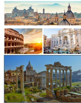
Voorpagina van de opdracht van dag 6

Op de laatste dag stond oorspronkelijk Vaticaanstad op de planning. Ik dacht terug aan hoe ik zelf als zeventienjarige na een week Rome de koepel beklom en gegrepen werd door het overweldigende uitzicht van bovenaf. Die koepel, daar lag de sleutel voor de finaleopdracht. Gedurende de week konden de leerlingen namelijk punten verdienen met elke opdracht en de negen overgebleven enthousiastelingen stonden allemaal dicht bij elkaar op de ranglijst. De finaleopdracht moest en zou tegelijkertijd in één uur beslecht moeten worden! Eenmaal begonnen luidde de opdracht voor hen heel simpel: stuur mij de sleutelzin .