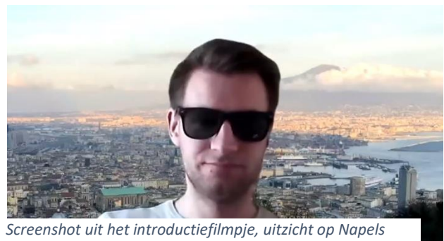
Screenshot uit het introductiefilmpje, uitzicht op Napels

Op de eerste dag hebben de leerlingen “Campanië verkend” door zich te verdiepen in de topografie van de streek. Door middel van raadsels kwamen ze bij een som terecht, waarvan het antwoord leidde tot een code. Aangezien ze met deze code het beoordelingsdocument van hun onderzoeksverslag (ten behoeve van de presentatie die ze op de reis zouden